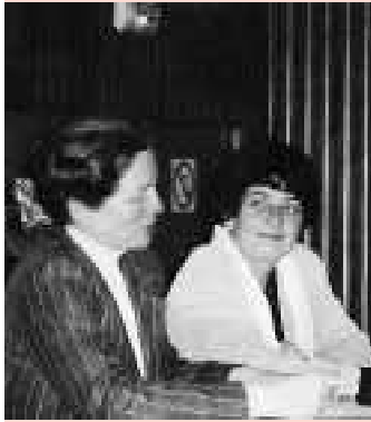
Pervenche BÉRÈS à Rennes :

«On a un devoir de contagion. en matière de paix».