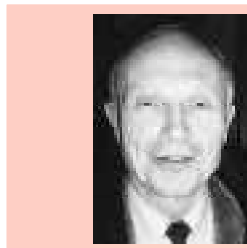
Par Loïc MORDREL

rêts de leurs ressortissants, ne sont pas en situation de faire des synthèses concernant l'ensemble de l'Union européenne. Cela explique que la coopération inter-gouvernementale a le plus souvent été facteur de paralysie. C'est d'ailleurs pour cette raison, l'expérience aidant, que de nombreuses matières ont été «communautaristes», à la demande des Etats membres eux-mêmes, dans le traité d'Amsterdam («communautarisation» des contrôles aux frontières, de mesures relatives à l'asile, à l'immigration, aux visas, à la coopération judiciaire et civile). Dans ces domaines, la Commission aura donc le pouvoir d'initiative.