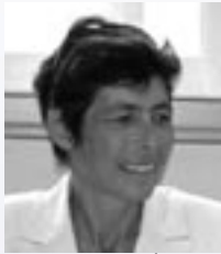
Virginie KLÉS, Maire de Châteaubourg