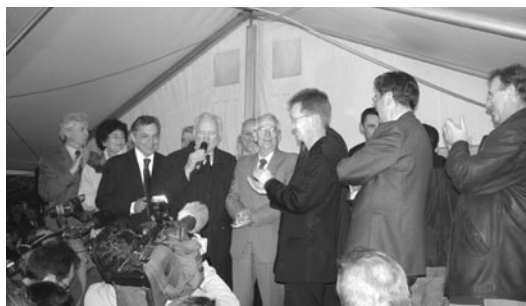
Georges Cano, élu Conseiller Général socialiste en 1973, acclamé par les socialistes le 28 mars dernier à La Harpe

En Ille-et-Vilaine, les éditions du Petit Démon lancent une nouvelle collection qui présentera des trajectoires variées, d'ordre politique, économique ou sociale.