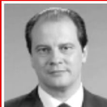
Jean-Christophe CAMBADÉLIS Membre du Bureau National du PS