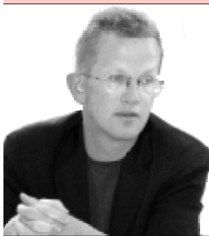
Par Frédéric BOURCIER Premier Secrétaire Fédéral