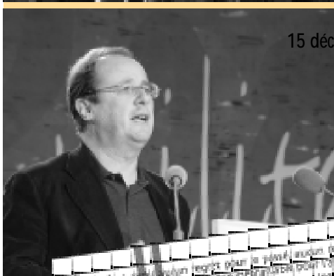
15 décembre, Journée Nationale «Débat Militant» à Montreuil