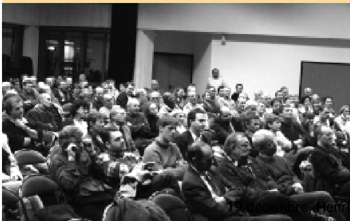
19 décembre, Henri Emmanuelli au Triangle